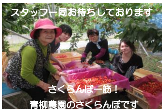
スタッフ同お待ちしております